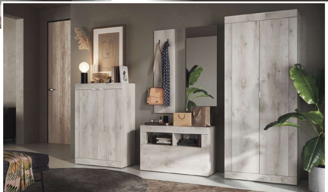
Roble Pino Blanco